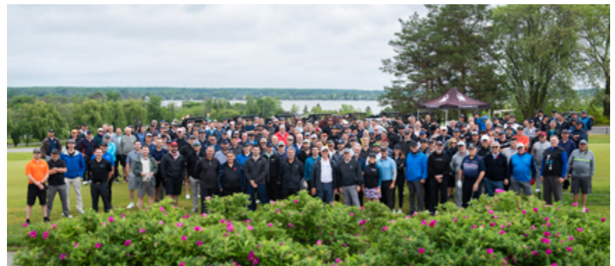
Photos du tournoi de golf 2023