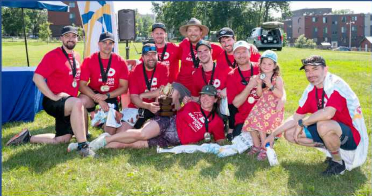
The A Team, l'équipe championne de 2023